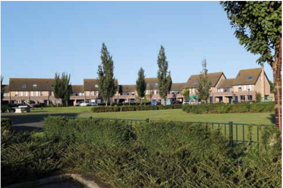
Wijk: Tremel te Krabbendijke