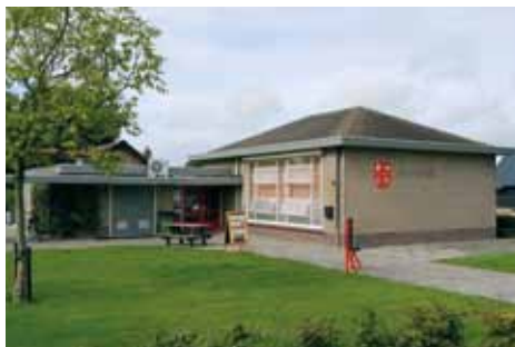
Gebouw "De Putter" te Oostdijk

We overdrijven niet als we zeggen dat Oostdijk een kern is met pit. Zo is het prachtig om te zien hoe de dorpswinkel functioneert. Een woord van waardering voor al die vrijwilligers is zeker op z'n plaats! Verder zijn we blij dat er op de voormalige locatie van Machinefabriek Van Burg aan het Bolwerk inmiddels een aantal woningen is gerealiseerd. Ten aanzien van de oude school aan de Vreijepolderstraat is er ook goed nieuws te melden. Naar alle waarschijnlijkheid wordt het gebouw binnenkort gesloopt en komen er drie woningen voor in de plaats.