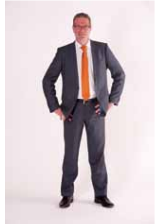
Tweede Kamerlid Elbert Dijkgraaf

Is dit een extreem voorbeeld? Was het maar waar! Er zijn méér voorbeelden doorgerekend. Het meest voorkomende verdienertype is een voltijdbaan gecombineerd met een deeltijdbaan. Of we nu een eenverdienerssalaris van € 60.000,- vergelijken met een salaris van € 40.000,- plus € 20.000,-, of een eenverdienerssalaris van € 80.000,- met € 50.000,- + € 30.000,-, het verschil in belasting bedraagt ook in deze gevallen minimaal € 8.000,-!