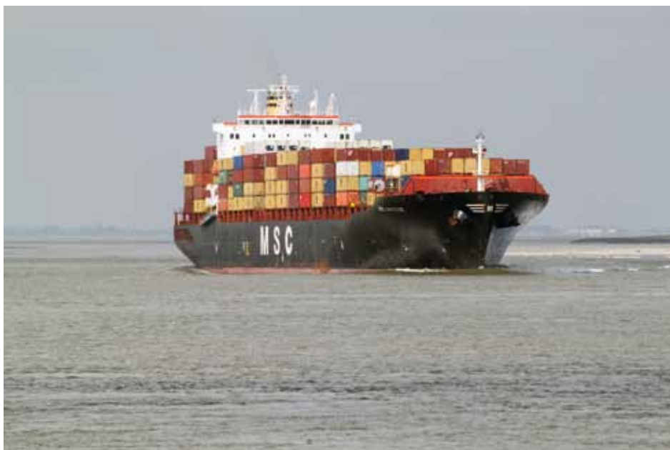
Nauw van Bath

derenvervoer en ook nog twee hoogspanningsleidingen. Aan de oost- en westkant van de gemeente bevinden zich het drukbevaren Schelde-Rijnkanaal met het Kreekraksluizencomplex en het Kanaal door Zuid-Beveland met de sluisen te Hansweert. Dan hebben we ook nog te maken met de Westerschelde, waar steeds meer en vooral grotere schepen in het Nauw van Bath elkaar passeren. Regelmatig vinden er op de Westerschelde aanvaringen of 'bijna' incidenten plaats, waarvan de gevolgen nauwelijks te overzien zijn. Onlangs nog verloor bij een aanvaring een tanker de gevaarlijke vloeistof styreen. Bij dit soort incidenten is communicatie met de burgerij van groot belang!