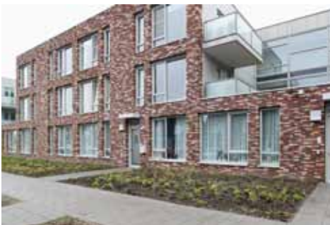
De nieuwe Vliedberg te Rilland

De staat waarin de 'Bathsewegkerk' verkeert, is voor velen in Rilland al jaren een doorn in het oog. Hoewel er ooit plannen zijn geweest om op de plaats van de kerk appartementen te bouwen, is het daar nooit van gekomen. In het afgelopen jaar hebben we het hele dossier nog eens tegen het licht gehouden en zijn we opnieuw in gesprek gegaan met de eigenaar van het kerkgebouw. Samen hebben we bekeken welke mogelijkheden deze locatie ons biedt en waar we tegenaan lopen. Uit deze gesprekken is gebleken dat het niet mogelijk is het kerkgebouw te behouden. Wel bestaan er mogelijkheden om de toren (met uurwerk en klok!) in stand te houden. Dat vergt echter een financiële bijdrage, zowel van de eigenaar als van de gemeente. Een andere mogelijkheid die momenteel wordt onderzocht, is de bouw van enkele woningen op het perceel van de kerk. Daarbij wordt nadrukkelijk gekeken naar de zuidoostelijke hoek van het kavel. Hoewel het een ingewikkelde kwestie is (tegenwoordig zegt men: een uitdaging!), hopen we het komende half jaar toch tot een definitief besluit te kunnen komen.