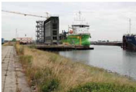
Scheepswerf te Hansweert

Slogebied vele malen beter dan aan het Kanaal door Zuid-Beveland.