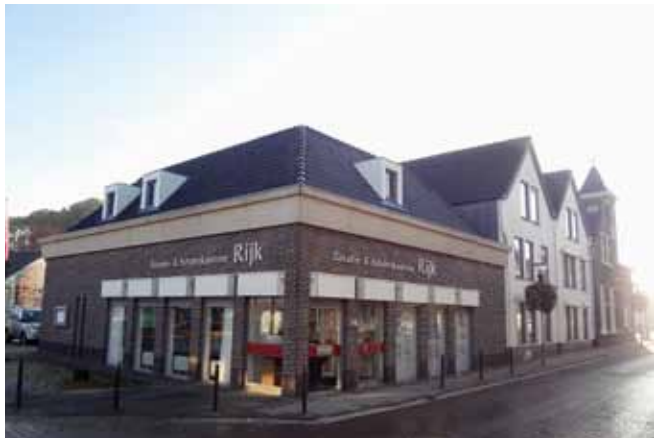
Advieskantoor Rijk te Kruiningen