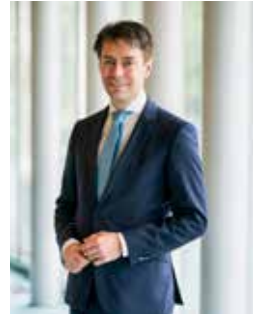
Chris Stoffer, Tweede Kamerlid SGP

Sinds april jl. zit ik voor de SGP in de Tweede Kamer. Het was even wennen, maar inmiddels heb ik m'n draai gevonden. Er is genoeg werk aan de winkel. Ik hou me bezig met de beleidsterreinen financiën, defensie, buitenlandse handel, sociale zaken, economische zaken, waaronder het energie- en klimaatbeleid, en niet te vergeten de portefeuille infrastructuur en waterstaat.