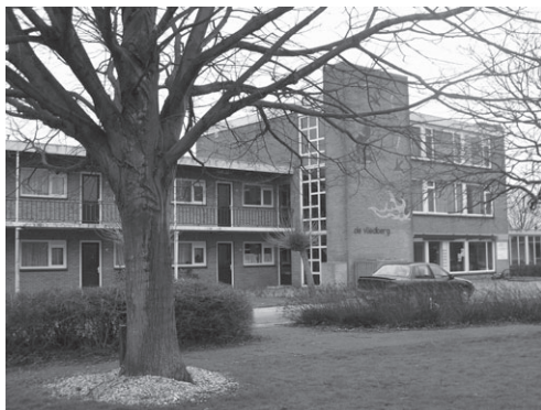
'De Vliedberg' te Rilland