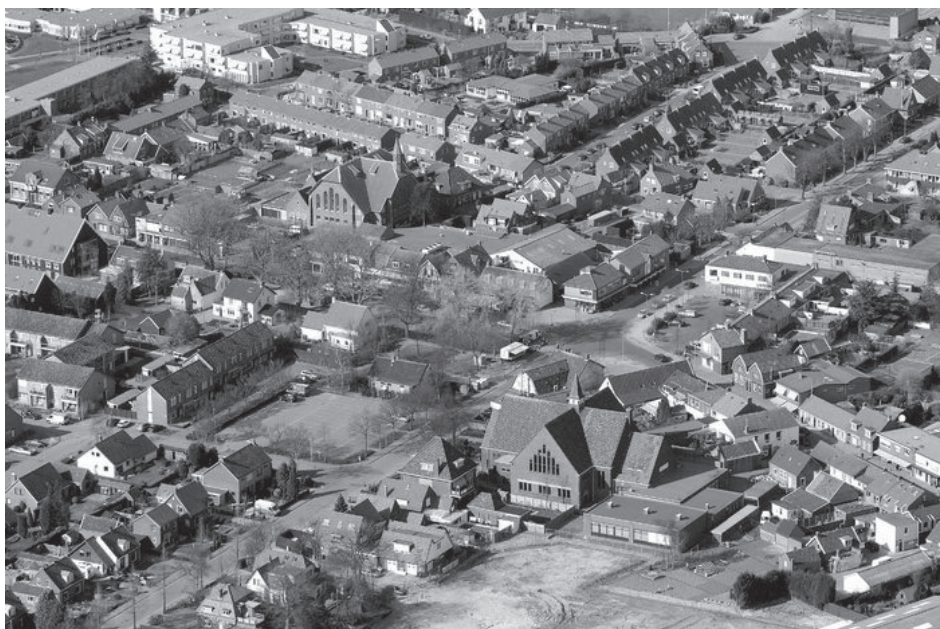
Luchtfoto Krabbendijke, met middenin op de voorgrond de parkeerplaats van de Geref. Gemeente