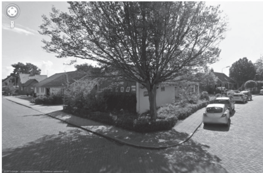
Groene Kruisgebouw Waarde

Na onderzoek van de GGD zijn zij tot de conclusie gekomen dat er in Reimerswaal twee vestigingen dicht kunnen. Er is toen gekeken welke vestigingen hiervoor in aanmerking kwamen, en dat zouden Kruiningen en Waarde moeten zijn. Kruiningen omdat deze gehuisvest is in een duur pand van Allevo, terwijl Allevo al had besloten dit pand te verkopen. In plaats van op zoek te gaan