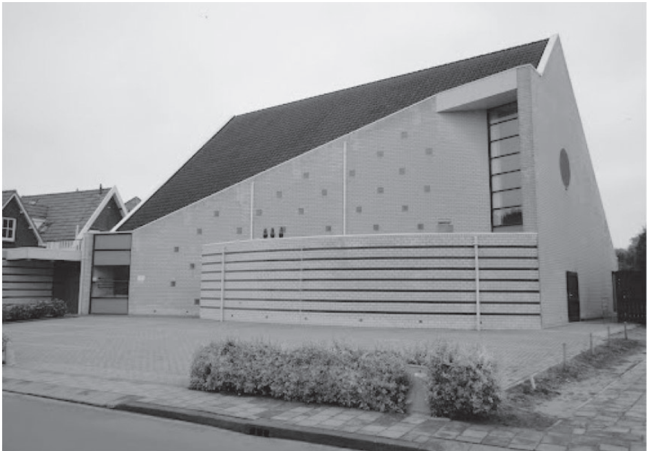
Kerk van de Gereformeerde Gemeente in Nederland aan de Stationsweg te Kruiningen

Plaatselijke Kiesvereniging 'Voor recht en vrijheid' te Yerseke Dinsdag 1 oktober 2013 om 19.30 uur in de kerk der Gereformeerde Gemeente te Yerseke. Ds. A. Verschuure uit Scherpenzeel.