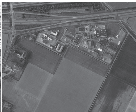
Bedrijventerrein 'De Poort' te Rilland