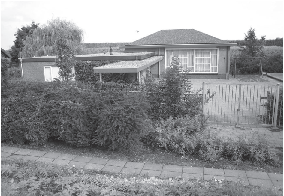
Voormalige kleuterschool 'De Puttertjes'

Men is tevreden, maar verlangt toch terug naar de periode dat je in de dorpswinkel even bij kon praten over het wel en wee.