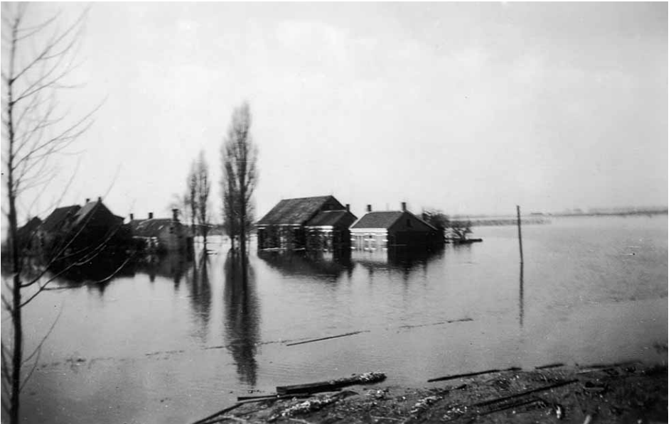
Gawege onder water