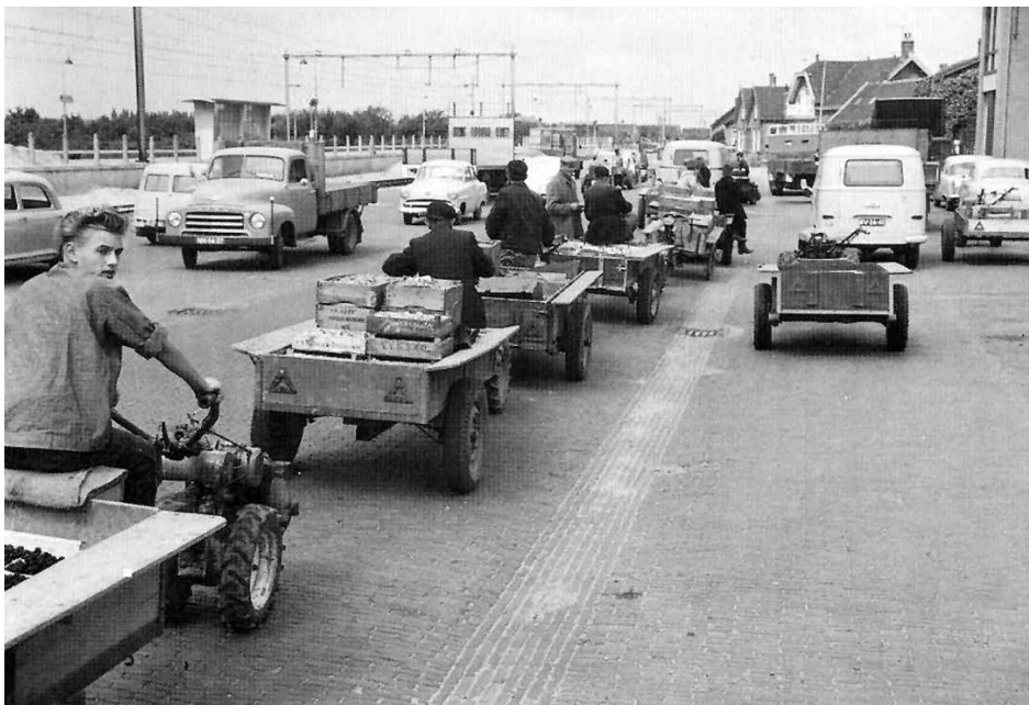
Met de tweewieler naar de veiling

De huidige “Greenery” in de Smokkelhoek, met de bekende gele zuil, dient slechts nog als opslagpunt met mogelijkheid voor sorteren.