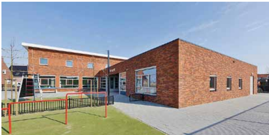
CBS 'De Bornput' te Oostdijk

nauw overleg met schoolbesturen gewerkt moeten worden. Een nieuwe brede school in Krabbendijke is bijvoorbeeld enige jaren geleden vanwege de ontbrekende financiële middelen voorlopig tot 2021 in de ijskast gezet.