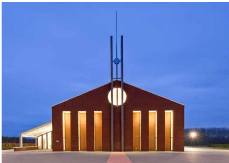
Adullamkerk der Gereformeerde Gemeente te Waarde

Donderdag 23 april 2015 om 19.30 uur in de kerk der Gereformeerde Gemeente te Krabbendijke, ds. W.J. Karels.