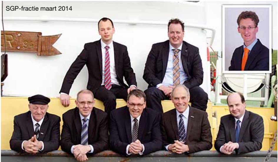
SGP-fractie maart 2014