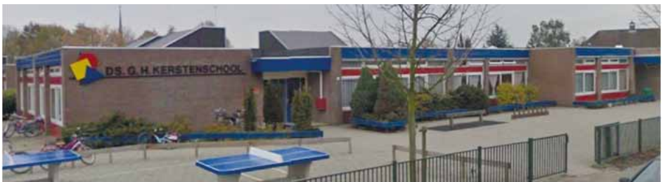
Ds. G.H. Kerstenschool te Yerseke

Bij aanvragen voor nieuwbouw en/of herstel van constructiefouten zal door de gemeente met het betreffende schoolbestuur nader bekeken moeten worden hoe hiermee omgegaan kan worden. Gezien de huidige financiële situatie van de gemeente is (vervangende) nieuwbouw niet vanzelfsprekend en zal er in