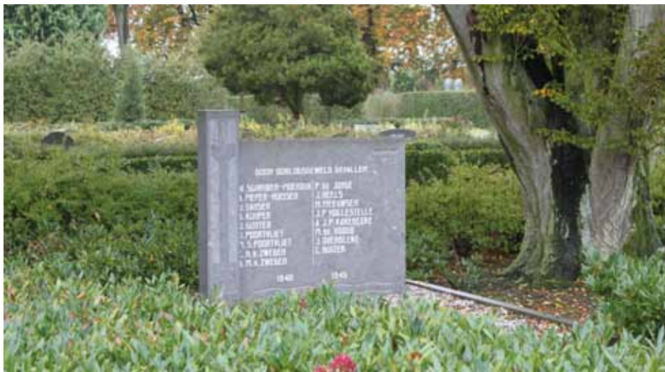
Oorlogsmonument op de begraafplaats te Krabbendijke

10 of 20 jaar en bij een kindergraf 100 jaar. Na afloop van die periode vervalt dit recht en krijgt de gemeente de zeggenschap over het graf, tenzij het grafrecht wordt verlengd.