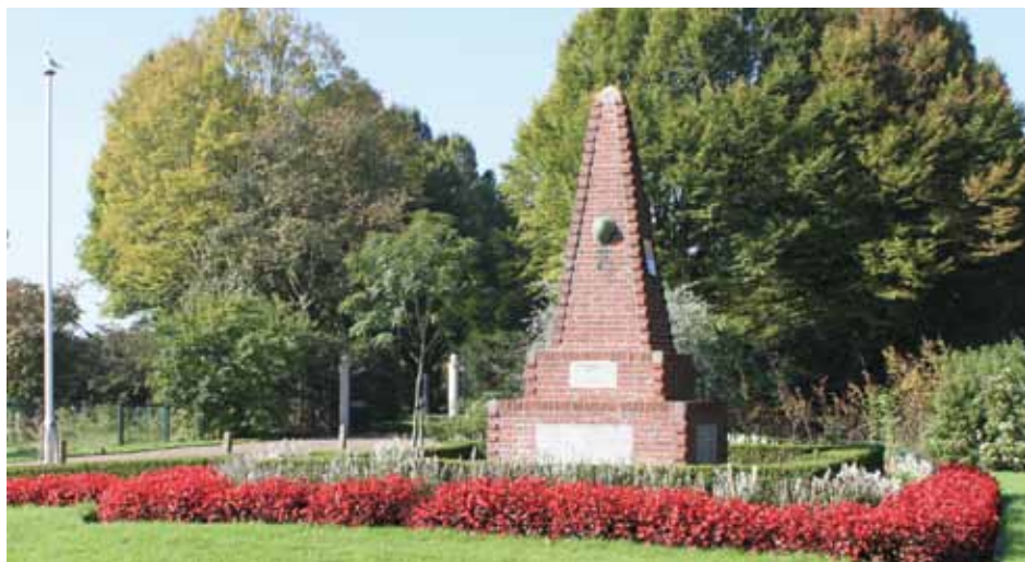
Oorlogsmonument bij de ingang van de begraafplaats te Yerseke