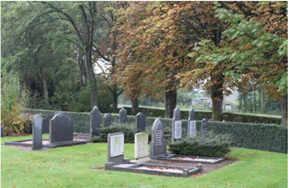
Teruggeplaatste grafstenen op het opgehoogde deel van de begraafplaats te Krabbendijke

We overdrijven niet als we zeggen dat we in Reimerswaal een uniek begraafbeleid hebben. Het unieke bestaat daarin, dat er geen graven worden geruimd, dat de tarieven in vergelijking met andere gemeenten erg laag zijn en dat de begraafplaatsen er in het algemeen netjes bijliggen. Dat er geen graven worden geruimd is reeds in 2008 door de gemeenteraad besloten. Dat besluit was in zekere zin opvallend, omdat in de meeste andere gemeenten in ons land wel graven worden geruimd. In een aantal gevallen gebeurt dit zelfs al na tien of vijftien jaar! Het besluit van de gemeenteraad om niet te ruimen wordt breed door de bevolking gedragen. Echter, dit besluit heeft wel consequenties voor de ruimte op de begraafplaatsen. Want ruim je geen graven, dan ontstaat er op zeker moment ruimtegebrek.